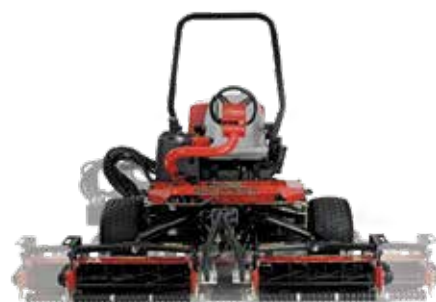
Reelmaster® 3100-D Sidewinder