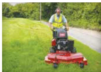
CORTADORES MANUAIS/ ESPECIAIS