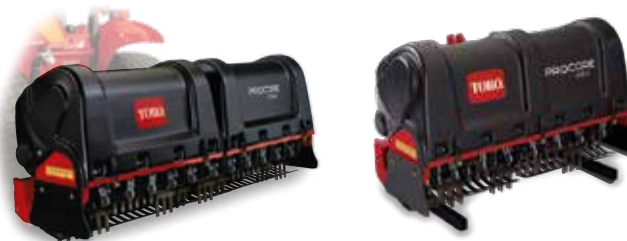
Aeradores ProCore 864/1298