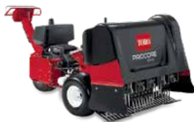
Aerador ProCore® 648