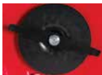
LÂMINA DE CORTE EM AÇO (HoverPro 500 & 550)