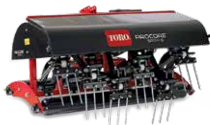
Linha ProCore SR de aeradores com pinos profundos

O processador ProCore rastreia, processa e dispersa tufo de aerificação em uma operação que busca retomar a condição do campo à prática de esportes em menos tempo, causando menos estresse ao gramado. O exclusivo engate OnePass também possibilita a conexão desta unidade ao seu aerador de três pontos para arejar e processar tufo em uma única passagem.