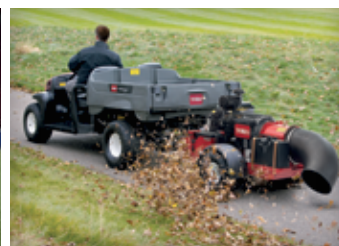
PEÇAS E SERVIÇOS 26-27