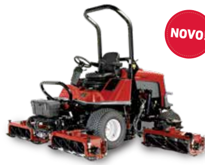
T4240 – Cortador de Serviço Pesado – 5 unidades de corte

O cortador helicoidal LT3340 pode ser adaptado para diversas situações, oferecendo desde aparagem leve até corte de áreas densas e cobertas de vegetação.