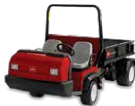
Workman série HD/HDX/HDX-D

Os veículos utilitários Workman MD/MDX/MDX-D aumentam a produtividade e garantem maior conforto ao operador com a tecnologia Superior Ride Quality (SRQ™), proporcionando a mais elevada capacidade de transporte de sua categoria.