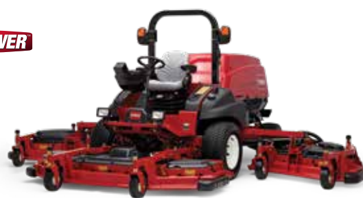
Groundsmaster 5900-D /5910-D

Os cortadores Groundsmaster 4100-D/4110-D possuem uma plataforma de aparagem totalmente frontal para maior visibilidade por parte do operador.