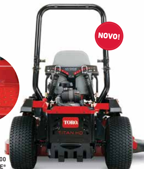
Série Titan® HD 1500 com MyRIDE®