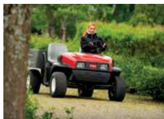
PULVERIZADORES/ VEÍCULOS UTILITÁRIOS 20-21

Pesquisa. Buscamos ouvir os profissionais da área e registramos suas opiniões para desenvolver novas soluções capazes de aumentar a produtividade e conservar os preciosos recursos presentes no mundo.