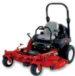
Linha Z Master® Professional 6000

Os modelos profissionais da série 6000 são reforçados com recursos adicionais para um desempenho suave e potente, incluindo um robusto sistema de pavimento suspenso para proporcionar um corte limpo em ladeiras.