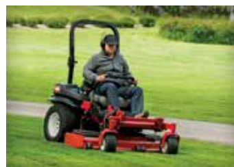
CORTADORES DE GRAMA COM RAIO DE GIRO ZERO