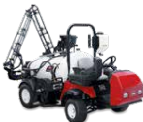
Multi Pro 1750

Os pulverizadores Multi Pro WM possuem um reservatório de aplicação de 757 litros que se instala no veículo utilitário Workman® HD. É possível realizar a conversão de transporte para uma pulverização precisa e consistente em até 30 minutos.