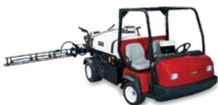
Multi Pro® WM