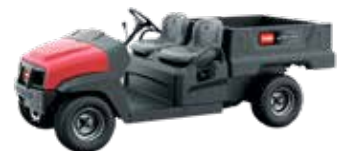
Linha Workman® GTX-D

Os veículos utilitários Workman HD/HDX/HDX-D reúnem força, durabilidade, carga útil excepcional e capacidade de reboque para os seus trabalhos mais exigentes. Muitos acessórios estão disponíveis para oferecer maior versatilidade.