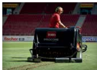
EQUIPAMENTOS PARA MANEJO DE GRAMADOS 24-25