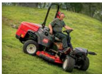
CORTADORES DE GRAMA ROTATIVOS