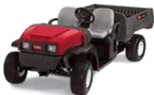
Linha Workman® MD/MDX/MDX-D