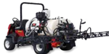
Multi Pro 5800-D

Os pulverizadores Multi Pro 1750 são dotados de uma bomba de diafragma de deslocamento positivo acoplada diretamente à velocidade do veículo, a fim de manter uma taxa de aplicação constante em uma gama de velocidades.