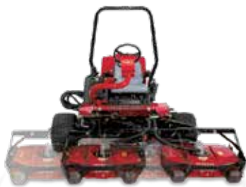
Groundsmaster® 3500-D Sidewinder