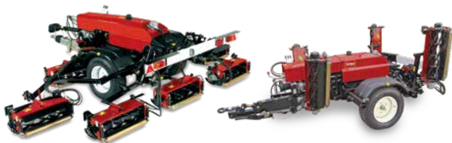
TM5490/7490 – cylinder med 5 och 7 enheter