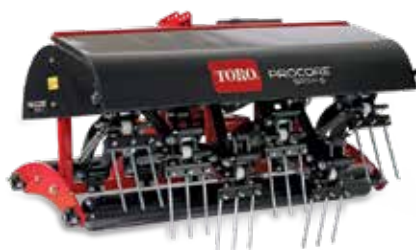
ProCore SR-seriens luftare med djupgående luftarpinnar

ProCore-processorn sopar, bearbetar och sprider ut gräspluggarna i ett enda arbetsmoment, så att banan är i spelbart skick på kortare tid och med mindre påfrestning på gräsytan. Med den exklusiva OnePass-dragkroken kan du fästa den här enheten på luftarens trepunktskoppling så att du kan lufta och bearbeta gräspluggar i ett svep.