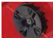
NYLONLINA (HoverPro 400 och 450)