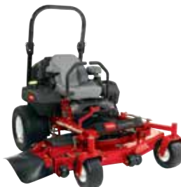
Z Master Professional 7000-serien

Modeller i Professional 6000-serien har ytterligare funktioner som ger smidig och kraftfull prestanda, däribland ett robust däckhänningssystem som ger ett perfekt klippresultat på sluttningar.