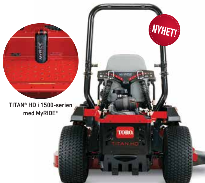
TITAN® HD i 1500-serien med MyRIDE®

MyRIDE-fjädringssystem har en fjädrande förarplattform och justerbara bakre stötdämpare som isolerar gupp och vibrationer, så att du inte känner av om terrängen är ojämn. Det är Toros välkända robusthet kombinerat med en otrolig komfort.