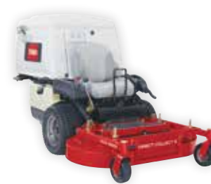
Z Master Professional 8000-serien

Klippare i Professional 7000-serien ger extra vridmoment vid extrema förhållanden. Tack vare dieselmotorn och den extra tåliga konstruktionen passar klipparen perfekt för dina mest krävande jobb.