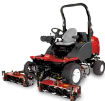
CT2240 – kompakt trippelklippare