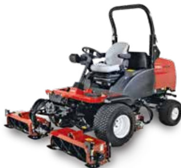
LT3340 – slitstark trippelklippare

CT2240-cylinderklipparen passar perfekt för områden med begränsad åtkomst och litet manövreringsutrymme.