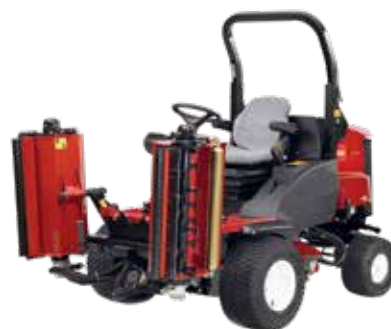
NYA LT-F3000 – slagklippare med tre enheter för kommersiellt bruk