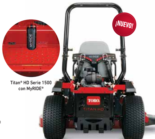
Titan® HD Serie 1500 con MyRIDE®

El sistema de suspensión MyRIDE consta de una plataforma del operario suspendida y amortiguadores traseros regulables para aislar los golpes y las vibraciones para que no note los terrenos irregulares. Es la resistencia que espera de Toro con una conducción tan suave que no se lo creerá.