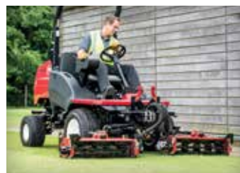
CORTACÉSPEDES DE MOLINETE / DESBROZADORAS 16-19