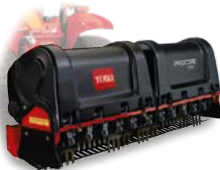
Aireadores ProCore 864/1298