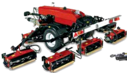
TM5490/7490 - Cortacésped de molinete de 5 y 7 unidades