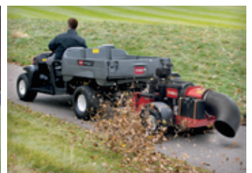
PIEZAS Y ASISTENCIA TÉCNICA 26-27