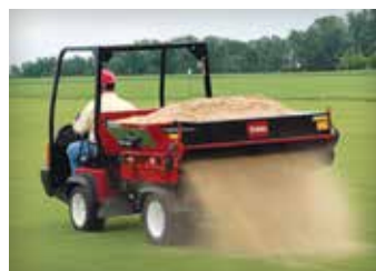
EQUIPOS DE APLICACIÓN DE PRODUCTOS & PRODUCTOS PARA EL TRATAMIENTO DE RESIDUOS 22-23