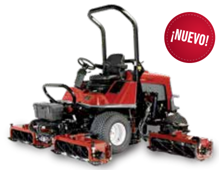
T4240 – Cortacésped de 5 unidades de alto rendimiento

El cortacésped de molinete LT3340 puede adaptarse a todo, desde el perfilado ligero hasta la siega de zonas de hierba densa y llenas de maleza.